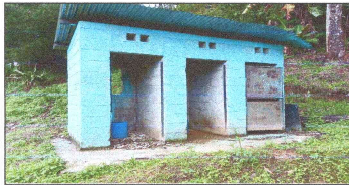
Foto 5: BAÑOS EN MAL ESTADO. INSTALACIÓN DE PUERTAS Y MEJORAMIENTO, MODULO 4.