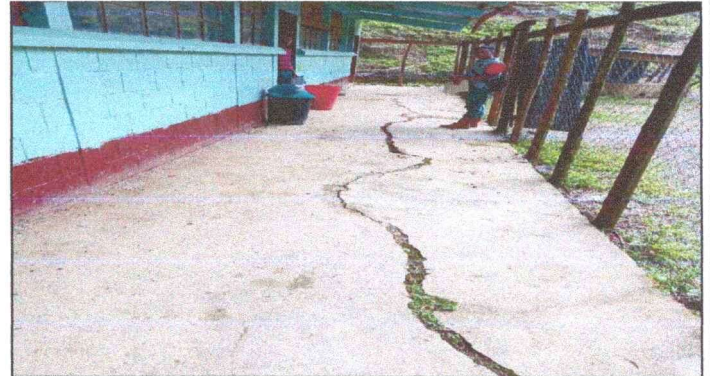
Foto 2: VISTA DEL CORREDOR EN MAL ESTADO. MEJORAMIENTO Y ALISADO DEL CORREDOR, MODULO 1.