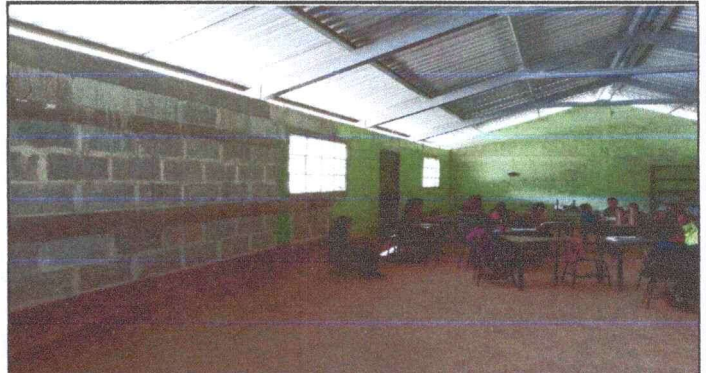
Foto 8: VISTA DE PARED EN MAL ESTADO. APLICACIÓN DE REPELLO, MODULO 3.