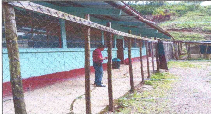
Foto 1: VISTA DE CIRCULACIÓN EN MAL ESTADO. SUSTITUCIÓN DE CIRCULACIÓN, MODULO 1.