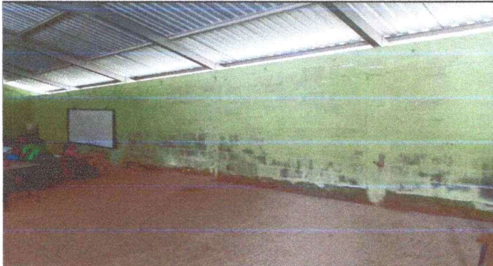
Foto 7: VISTA INTERNA DE PARED EN MAL ESTADO. APLICACIÓN DE REPELLO, MODULO 3.