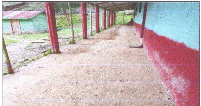
Foto 10: VISTA COMPLETA DEL CORREDOR EN MAL ESTADO. APLICACIÓN DE ALISADO, MODULO 3