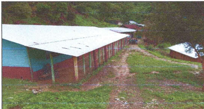
Foto 9: VISTA DE PARED EN MAL ESTADO. REPELLO, ALISADO DE PISO Y MEJORAMIENTO DE CIRCULACIÓN, MODULO 3.